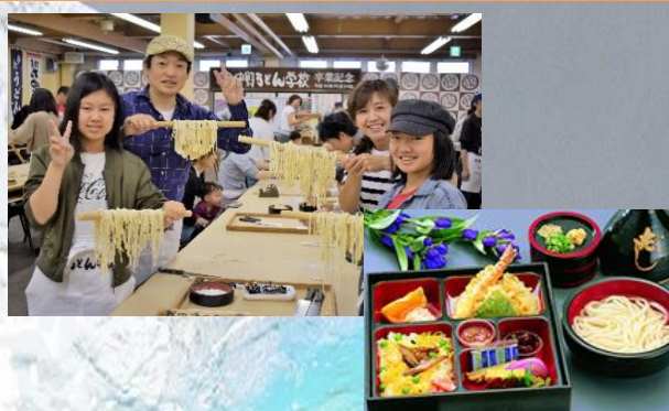
体験・昼食(イメージ) 食事内容、器等は変更になる可能性があります。